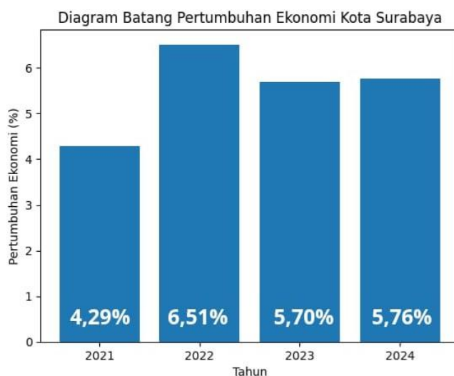
Gambar 1. Data Peningkatan Ekonomi Surabaya

Banyaknya jumlah kampung tematik di kota Surabaya yang telah diberdayakan, faktanya berdampak signifikan terhadap pendapatan kota Surabaya. Kampung-kampung tematik ini masih menjadi salah satu andalan serta keunggulan kota Surabaya sebagai penonggak roda perekonomian dan kesejahteraan umum, sekaligus menjadi tolak ukur kota percontohan.