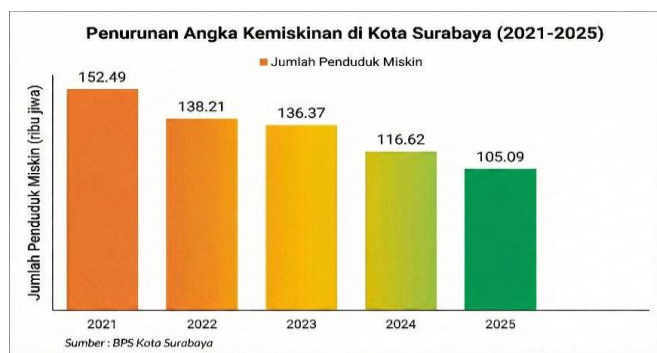
Gambar 2. Data Penurunan Angka Kemiskinan Surabaya

Disamping adanya peningkatan ekonomi di Surabaya, terdapat angka kemiskinan yang kian menurun di kota Surabaya dari tahun ke tahun. Pada tahun 2021 yang semula jumlah penduduk miskin sebesar 152,49, turun drastis pada tahun 2025 sebesar 105,09 dalam satuan ribu jiwa. Ini menunjukkan mulai meningkatnya kesejahteraan umum, dan dibantu dengan adanya pemberdayaan kampung tematik yang tersebar di kota Surabaya. Pada periode 2021-2025, penurunan angka kemiskinan sebesar 47,4 ribu jiwa yang notabene ini merupakan angka fantastis dalam konteks penurunan angka kemiskinan. Angka-angka ini dapat terus ditekan dengan adanya kontinuitas Gerakan dalam memberdayakan kampung tematik yang ada di kota Surabaya.